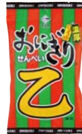
おにぎりせんべい 乙

濃厚味が好評の「おにせんクラッシュ」の新バージョンは、三角形の形のままで生地に特製タレをしみ込ませる新製法です。サクサクとカリカリの食感で、一度食べたらくせになる禁断の(?)「おにぎり」です。