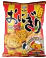
おにぎりせんべい ソース味