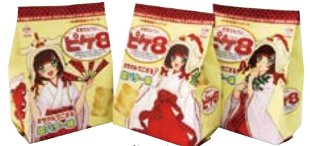
ピケイト 40周年記念“ミラクル”パッケージ

ピケイトの発売40周年を記念して、限定パッケージが発売されました。巫女のコスチュームに身を包んだ少女キャラ《天宮鈴(あまみやすず)ちゃん》は、大阪総合デザイン専門学校様の協力の下、公募作の中から決定しました。中味のピケイトは、通常品よりもさらにバター風味を豊かにし、形状も小さ目サイズの波型に変更して、食べやすさとかわいらしさをアップしました。