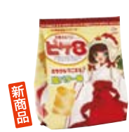
ビケイト 40周年記念「ミラクル」パッケージ