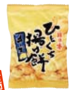
ひとくち揚げ餅 チーズ