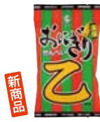
おにぎりせんべい 乙