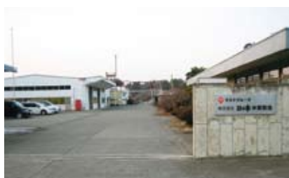
(株)日乃本米菓製造