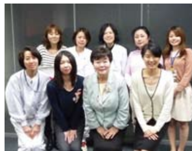
男女共同参画社会の実現に向けて