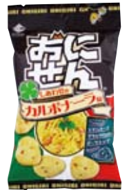
おにせん しあわせのカルボナーラ味