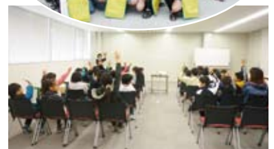
工場見学の受け入れ