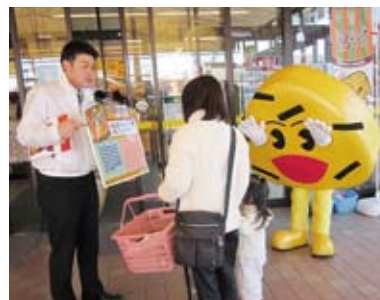
「おにぎりせんべい」47都道府県 認知度調査