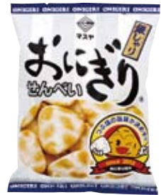
おにぎりせんべい・銀しゃり

人気商品「おにぎりせんべい」の新バージョン。ザクザク食感の厚焼きおせんべいに「鳴門の焼塩」と「天日湖塩」の大きさの違う「つぶ塩」を付け、お米の旨みを引き立てました。塩の粒をせんべいの表面に付着させる新製法は、特許出願中です。シンプルながら深い味わいをお楽しみください。