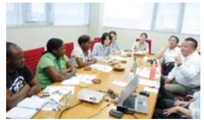
マラウイ共和国(アフリカ)からの視察見学①

JICAが主催する国際研修活動の一環として、マラウイ共和国から研修生の皆様が視察見学に来社されました。地域資源を商品開発に取り入れることの課題や展望、現在取組んでいる事業の内容などをお話し、意見交換をしました。