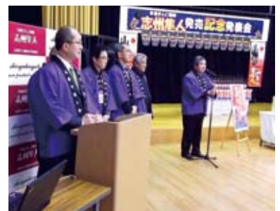
きんこ芋での町おこし

さらに製造工程で発生した焼酎粕を肥料としてきんこ芋畑に戻す環境に優しい「サステナブルな循環型システム」を構築するための共同研究を国立大学法人三重大学大学院と行っております。