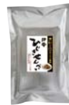
伊勢ひじきせんべい