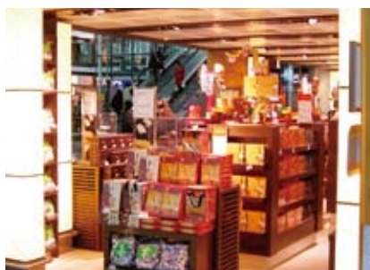
香港空港内免税店売場

●ミッション 在香港, 为日本和中国的食品提供全面的最佳的推广服务 香港における、日本と中国の総合食品コンシェルジュを目指します。