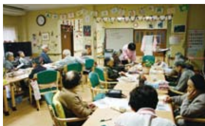
ポピー・デイサービスセンター