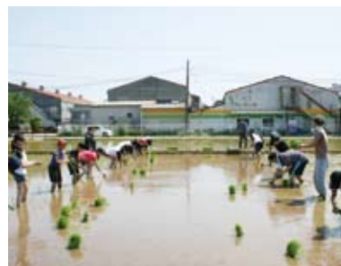
稲作委員会の活動①