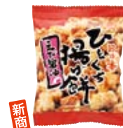
ひとくち揚げ餅 えび醤油