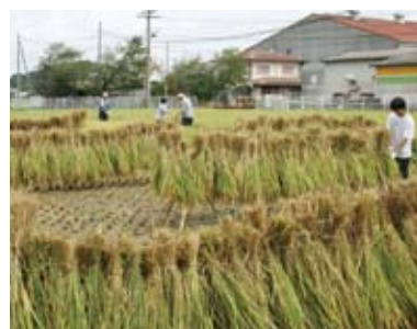
稲作委員会の活動②