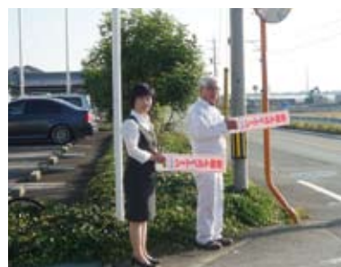
シートベルト着用推進運動

外城田川沿岸の自治会の皆様らと共に、堤防敷きの草刈りとゴミ拾いを行いました。地域におけるこうした活動は年々参加者が増えて盛んになっており、ゴミも減ってきているそうです。地元企業の一員として、地域を美しくする活動に関わることができ清々しい気持ちになりました。