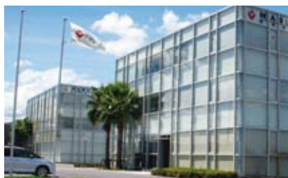
(株)マサヤグループ本社