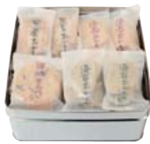
小缶 四種詰め合わせ (せんべい・おかき)