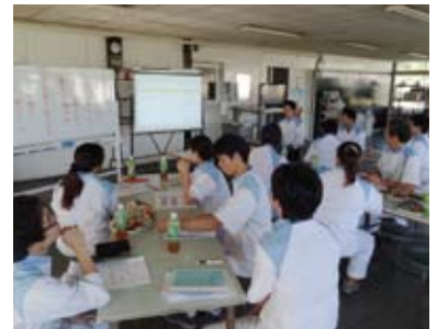
経営方針納得会_㈱日乃本米菓製造