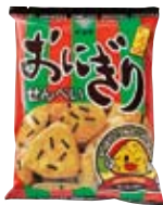
おにぎりせんべい