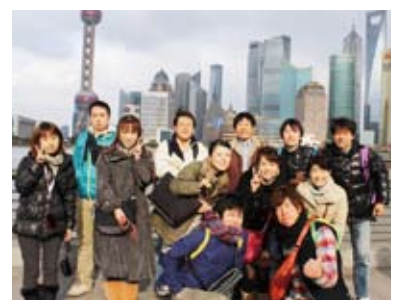
中国サークル研修旅行

中国サークルは、将来に向けてお互いを理解し合うことが必要な日本と中国の隣人関係に鑑み、若い世代を中心に三重大学の中国人留学生の方々と文化交流を行おうというものです。今年度は、ここ1年間の活動のハイライトとして、サークルのメンバー有志で実際に中国を訪問し異文化を体験してきました。経済成長著しい上海の様子は特に印象深く、わずか数年で一気に世界の経済大国へと駆け上がった中国の熱気を直に感じることができました。