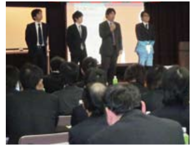
経営方針納得会_㈱マスヤ