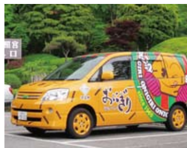
おにぎりせんべいキャラバンカー

春の田植えには、従業員のお子さんや社外の方も参加していただき、明るい笑い声や掛け声が飛び交いました。秋の稲刈りでは、OBの先輩方から機械がなかったころの苦労話も伺いながら、豊かに実った稲を大切に刈り取りました。またこの間、田植え前の田おこし、畦ぬり、水入れ、田かきなどの準備や、草刈り、水の調整などの大切さ、大変さも学びました。約二反の田んぼから、17俵(約1トン)の米を収穫することができました。