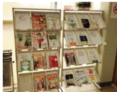
本の貸出コーナー設置