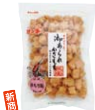
杵もち揚 海老マヨ味