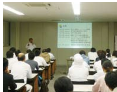
先輩の話を開く会