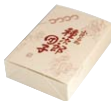
小名物 種次郎団子