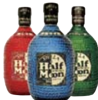
ハーフムーンシリーズ