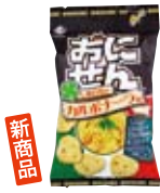
おにせん しあわせのカルボナーラ味