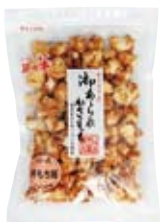
杵もち揚 しょうゆ味