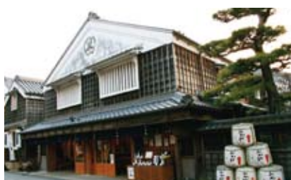
(株)伊勢萬 内宮前酒造場