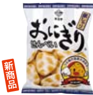
おにぎりせんべい 銀しゃり