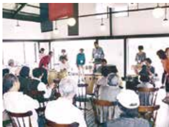
未来創造委員会(ラテンパーカッション)

(株)日乃本米菓製造の広大な敷地は、これまで一部が雑木林や荒地になっていました。そんな中、太陽光をはじめとする再生可能エネルギーの買取り制度が施行されたため、太陽光発電による売電事業に参入することになりました。旧倉庫を解体し、雑木林を伐採し、きれいに整地した約12,000㎡の土地に太陽光発電パネル4200枚を設置。想定発電量はクリーンエネルギー1,000kw以上、いわゆる「メガソーラー」です。これは一般的な家庭の約三百世帯分の年間消費電力を賅うことが出来る規模で、2014年4月から発電を開始しました。