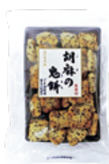
胡麻の鬼餅 (ごまのきもち) (株)日乃本米菓製造