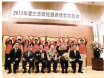
経営品質賞奨励賞 (エムケイ)