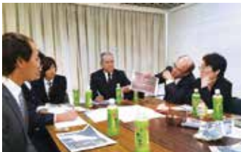
経営方針納得会(マस्या)

MG(マネジメントゲーム)研修は、事業活動から利益が生まれる仕組みを一般の社員にも理解してもらうために行なっている社内研修です。今年は、グループの従業員にもっともっとMG研修にのめりこんでもらうため、“MG祭り”を企画しました。優勝賞品のハワイ旅行(経験者の部)、国内旅行(初参加者の部)をめぐる31名の参加者による4ヶ月間の熱い戦いが繰り広げられました。笑いあり、悔しさありの長い戦いを制したのは、入社2年目のマस्याの営業系社員。おめでとう！