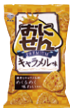
おにせんプレミアム キャラメル味 (株)マस्या