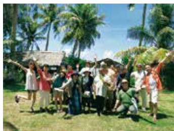
式年遷宮年を乗り切った！記念旅行・グアム 2014