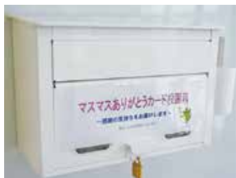
マスマスありがとうカード

「ちょっと言い辛いことなので、普段の場では言い出せない。でも大事なことなので、どうしても言っておきたい」というようなコミュニケーションを助ける場として、少人数でお酒や食事を共にしながら堂々と仕事の話をする「コンパ制度」を開始しました。リラックスした雰囲気の中で腰を据えてざっくばらんに話が出来ると、好評を得ています。