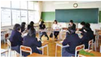
地域の研修 (ビジネスパーク伊勢)