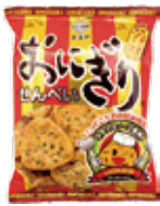
おにぎりせんべい ソース味