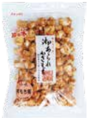
杵もち揚しょうゆ味