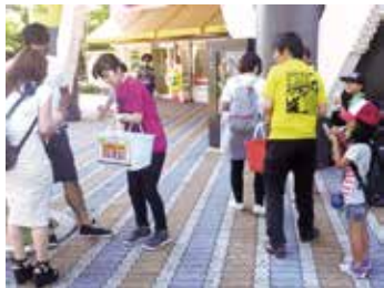
コロクーズ全国10万袋サンプリング