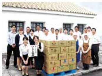
進撃の伊勢萬 ASEANへ本格的に輸出開始