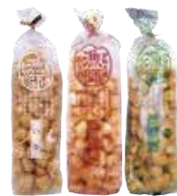
漁師あられ いか・えびしお・あおさのり