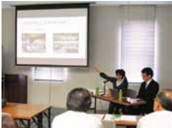
地域の研修 (イキイキ元気な組織から学ぶ講座)