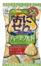
おにせんプレミアム ハーブソルト (株)マस्या