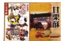
栗餡入ソフトクッキー 甘栗酥