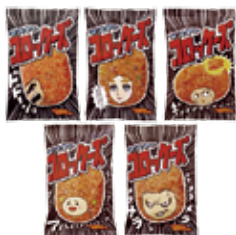
コロッキーズ (株)マस्या