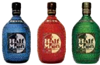
ハーフムーンシリーズ