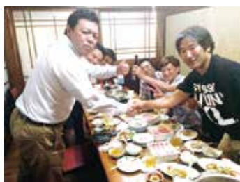
マスヤコンパ（営業 & 製造）