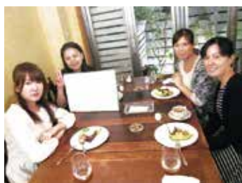
マスヤコンパ（女性）