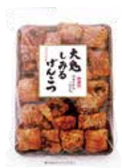
大鬼しみるげんこつ