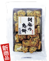
ごまのきもち 胡麻の鬼餅