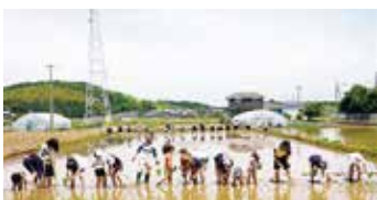
稲作委員会の活動