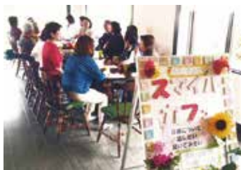
未来創造委員会(スマイルカフェ)

今後も、高齢者比率が高まる伊勢を中心とした南勢地域にあって、社会のニーズを的確に捉え、必要なサービスを充実させていきます。『ポピー』が地域にとってなくてはならない存在、と言っただけのような活動します。