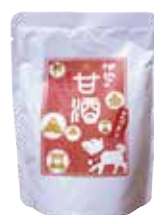
レトルト甘酒 (株)伊勢萬