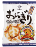
おにぎりせんべい 銀しゃり