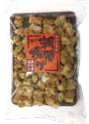
潮騒揚げあおさ塩ダレ