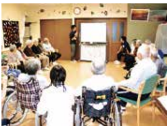
大学生介護体験実習の受入れ