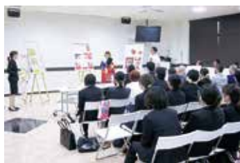
OCA、プレゼンテーションの様子