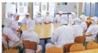
マスヤ包装部門・班ミーティング

伊勢では 2013 年に第 62 回神宮式年遷宮の本年を迎え、両宮合わせて 1400 万人もの参拝者が訪れました。伊勢萬ではこの来訪者をお迎えすべく、数年前より伊勢ならではの商品ラインナップに力を入れることを決め、新商品の開発や、来店者へのカタログ配布、店づくりなどみんなで一丸となって取り組んできました。おかげさまでその事業目標を見事に達成し、記念としてグアム従業員旅行へ行くことができました。業務の都合上 2 班に分かれての旅行でしたが、普段接さない他部署の方々とも楽しいひとときを共有し、仲間の絆を深めることができました。目の回るような忙しい一年間でしたが、みんなで助け合い勝ち取った最高の経験でした。