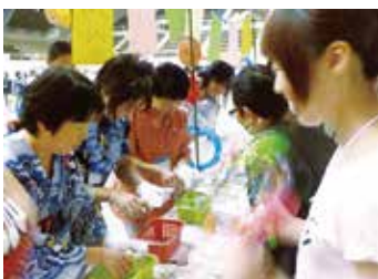
第7回従業員大会(エムケイブース)

マस्याグループの従業員大会も今回で7回目を迎えました。普段の仕事では顔を合わすことの少ない各社各部署の従業員が一堂に会し、グループ各社のこと、働く仲間のことを、より身近に感じる機会です。今年は、従業員のご家族の皆さんにもお子さん連れで参加していただきたいという思いで、夏休みの最後の週末に“夏祭り”という企画で盛り上げました。妖怪ウォッチのようかい体操第一をみんなで踊ったり(サプライズ)、各種ゲームブースを設けて楽しみ、会場のあちこちに可愛い笑顔があふれました。夏祭りらしい服装でよろしく！との呼びかけに、浴衣や仮装をしての参加者も多く、これまでの従業員大会とは一味違った雰囲気になりました。