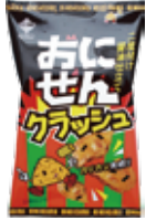
おにせんクラッシュ