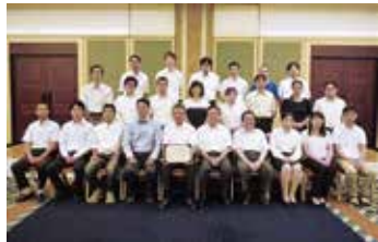
経営品質賞奨励賞 (日乃本)