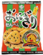
おにぎりせんべい