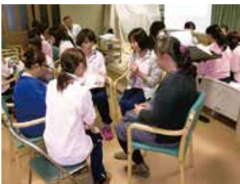
経営方針納得会(エムケイ)

従業員のホンネの意見や要望を聞き、経営品質向上に活用するため、外部の調査機関を使って全従業員アンケートを実施しました。『わたしは、総合的に考えると当社の従業員として満足している』という問いかけには、『非常にそう思う』『そう思う』と答えたのは、2014年春が50.5%、2014年秋が55.0%でした。その他たくさんの項目に対する回答結果やフリーコメント欄への意見を踏まえ、各社で改善を進めています。中には厳しい意見もありますが、そういう意見も含めてのアンケート調査なので、少しでも社内で本音のキャッチボールができればという思いです。あわせて、“誰かが良い会社にしてくれるのを待つのではなく、一人ひとりの努力や思いも必要ですよ”という呼びかけも行っています。