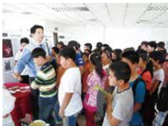
工場見学 (万寿家 (天津) 食品) ①

「今までにない斬新な伊勢志摩土産のパッケージデザインを開発しよう」というコンセプトのもと、大阪コミュニケーションアート専門学校 (OCA) の学生 38 名に、半年間、正規の授業課題として取組んでもらう産学協同企画を実施しました。若者らしいみずみずしい感性による斬新でユニークなものだけでなく、すぐに商品化できそうな優秀なアイデアも多く、ポテンシャルの高さに驚かされました。今後、これらのデザイン案をブラッシュアップし、新製品に活用していく予定です。