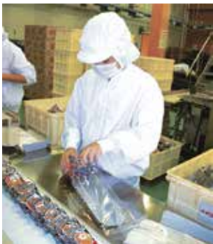
インターンシップの受入れ