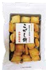
こがし餅 (株)日乃本米菓製造