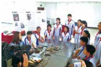
工場見学 (万寿家 (天津) 食品) ②

中国では食の安心を脅かす事件が頻発しており、市民の間に根強い不安感があります。万寿家 (マस्या) ブランドに込めた安全・安心への思いを伝えることで、食品産業への信頼を感じてもらおう一助になればよいと思っています。従業員の側も、地域の子供たちの見学受け入れにより仕事に誇りを感じています。今後は、一般の観光客や親子連れの見学も企画し、天津マस्याのファンを沢山作ることができればと思っています。