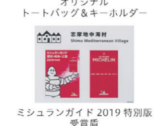
ミシュランガイド 2019 特別版 受賞盾

伊勢萬トレーディングでは、環境保護の観点から世界的に注目されているプラスチック代替品（土に還る生分解性原材料）のストローやレジバッグ、またオーガニック綿を使ったエコバッグ等の直輸入と国内販売を進めています。2020年春に東京で開催される国際見本市にブース出展の予定です。