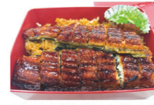
おもてなし弁当（ひつまぶし弁当）