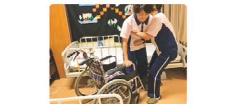
職員によるロールプレイング研修 移乗