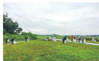
神宮奉納花火大会後の清掃 打ち上げ場所でのゴミ拾い

市内の中学校に地域の第一線で活躍する社会人が出前授業を行う「ビジネスパーク伊勢」（主催：伊勢商工会議所）に、毎年グループから数名が参加しています。学校の先生方だけでは教えきれない生きた社会の仕組みや地域の産業の成り立ちなどについて話し、地域企業に魅力を感じてもらい、将来の地域での就業、活躍に役立てて欲しいと願っています。