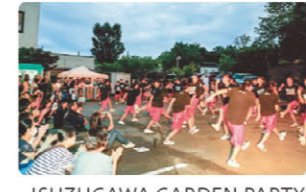
ISUZUGAWA GARDEN PARTY ダンス部のパフォーマンス

配食サービスでは、高齢者の方々に管理栄養士監修のバランスの取れたお弁当を月曜から土曜の昼・夕に配達していますが、足腰が弱く自宅に引きこもりがちでなかなか外食が出来ない方の、“たまにはちょっと贅沢したい”という「プチ贅沢ニーズ」を叶えるべく、6月から1,500-1,600円の高価格帯のお弁当（通称「おもてなし弁当」）を月1回始めました。初回は定番のうなぎ弁当で、想定を超える数の嬉しいご注文を頂きました。