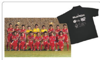
地元サッカーチーム「FCヤマト」

（天津テレビ局少年児童チャンネルからの取材） 天津マサの羊羹とチョコレート商品の紹介、工場見学について取材がありました。小学生と先生が出演する番組で、天津マサ商品と工場見学、チョコレートDIY体験の様子が紹介されました。