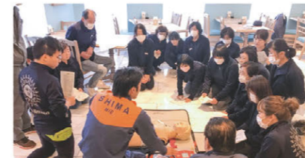
AED研修 (志摩地中海村)