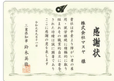
障がい者雇用の推進 感謝状