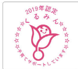
くるみん認定ロゴマーク