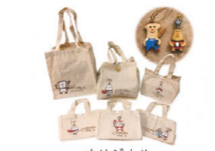
オリジナル トートバッグ&キーホルダー

2019年2月、志摩地中海村のメインダイニングがリニューアルオープンしました。世界中の美食家から注目されているスペイン・バスク地方のサン・セバスティアンにてミシュラン1つ星の評価を得た名店「Kokotxa（ココチャ）」とのコラボレーション「RIAS by Kokotxa」の誕生です。Kokotxaオーナーシェフのダニエル・ロベス氏の指導の下、太田料理長を中心に現地研修を含めた技術交流を行っております。「新バスク料理」の流れを汲み、伊勢志摩の豊かな海の幸・山の幸で創作する逸品の数々。お泊りのお客様はもちろん、志摩地中海村にお越しくださった全ての方に素晴らしい美食体験を楽しんでいただくことができます。