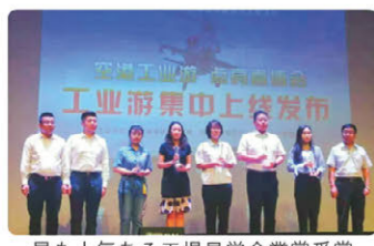
最も人気ある工場見学企業賞受賞

地元のバイクチーム「AKENO SPEED・YAMAHA（アケノスピード・ヤマハ）」の鈴鹿8時間耐久ロードレースへの出場に協賛し、応援に駆け付けました。鈴鹿8耐は、FIM世界耐久選手権シリーズとして、毎年夏に鈴鹿サーキットで開催される日本最大のオートバイレースです。ピットウォークではおにぎりせんべいを配布させていただき、全国各地のお子様から高齢の方、外国人の方などたくさんの方に知っていただく良い機会になりました。