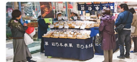
日乃本の催事出店 店舗の様子