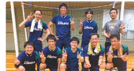
フットサルクラブ