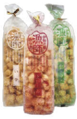
漁師あられ いか・えびしお・あおさのり