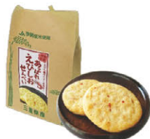
えびしおせんべい