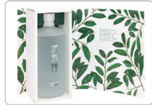
クラフトジン「伊勢神」

新発売のジャパニーズクラフトジン「伊勢神（いせじん）」は、“伊勢萬だからこそその製品”をコンセプトにワンチームで作上げた商品です。ネーミングとデザインについては、社内から集めた意見をもとに熱い議論を経て決定しました。カギとなる酒質の設計にあたっては、伊勢志摩の豊かな自然が育んだあおさ・伊勢茶（ほうじ茶）をはじめとする6種類のポタニカル（植物由来の原料）を用いて製造した原酒を、開発技術者がそれぞれの香りを最大限に引き出せる絶妙の配合で仕上げました。伊勢の蒸留所で製造された、伊勢萬みんなの思いが詰まった「伊勢神」、必ずお客様に喜んでいただける自信作です。