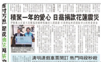
現地新聞への記事掲載

2018年2月6日に台湾東部にある花蓮市で大きな地震が発生しました。日本が東日本大震災で被災した際、いち早く駆け付け援助の手を差し伸べてくれた台湾の方々之恩返しをするべく、おほらい町の店舗で寄付を募る活動を行いました。伊勢を訪れる観光のお客様だけでなくグループの従業員からも寄付金が集まり、一年後の2019年2月に花蓮市を訪問し花蓮市長へ直接寄付金をお渡ししました。（※写真は花蓮市長と共に市長室で地元メディアから取材を受けている様子）