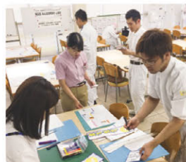
MY委員会による壁新聞づくり