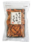
染み込みしょうゆ かきもち