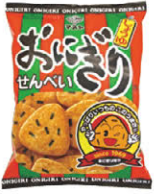
おにぎりせんべい