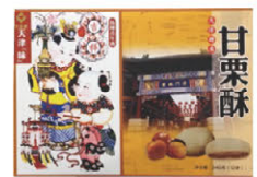
栗餡入ソフトクッキー 甘栗酥