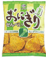
おにぎりせんべい わさび