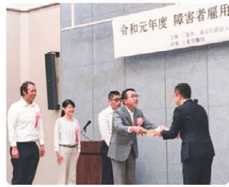
障がい者雇用の推進 感謝状交付