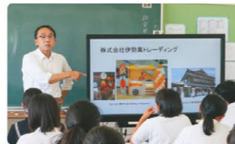
ビジネスパーク伊勢