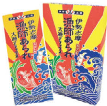
漁師あられ 大漁デラックス (小箱・大箱)