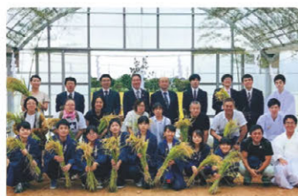
「神都の祈り」プロジェクト