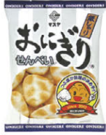
おにぎりせんべい 銀しゃり