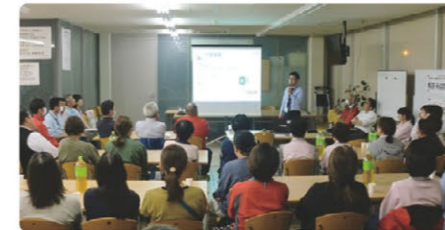
経営方針納得会 (エムケイ・コーポレーション)

(朝礼) 毎朝、担当者が「理念トーク集」などからテーマを決めて説明した後、部署や役職に関係なくランダムに決めた3~5名の小グループで5分間程度の意見交換をします。