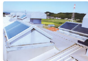
屋根と換気扇の修理

また、日乃本米菓製造では2020年夏の稼働開始を目指して新工場の建設を進めています。本格稼働の際には、安全衛生レベルの向上と、より良い品質、より高い生産性の両立が期待されます。 注）TOC (Theory Of Constraints) とは、「工場の生産性はボトルネック工程の能力以上には向上しない」との認識に基づき、ボトルネック工程に着目することで在庫・仕掛を減らし、個々の工程ではなく工場全体の生産性を上げようとする考え方で