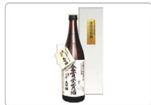
全国新酒鑑評会金賞受賞酒

平成30酒造年度全国新酒鑑評会（令和元年5月17日結果発表）にて金賞を受賞しました。2年連続金賞を目指した昨年は惜しくも入賞に終わり、「今年こそは金賞を！」という意気込みで酒づくりに臨みました。全員で一丸となり、各工程を丁寧に仕上げたことが今回の受賞につながりました。今年の受賞酒は香りが高く、スッキリとした味わいの大吟醸に仕上がりました。これからも皆で力を合わせ、更なる酒質の向上に取り組みしていきます。