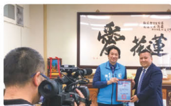
台湾花蓮地震への義援金活動

伊勢YAMATO FCは伊勢を本拠地とする社会人サッカーチーム（三重県リーグ1部）。地元で青少年サッカー教室を行う等、サッカーを通じた人づくりに力を入れており、地域に愛されているチームでもあります。伊勢勢萬トレーディングでは、彼らの思いに共感し、今後もユニホームパートナーとして応援していきます。