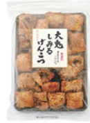
大鬼しみる げんこつ