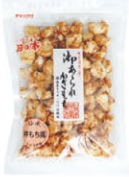
杵もち揚 しょうゆ味