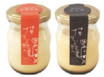
伊勢プリン (なめらか・レトロ)