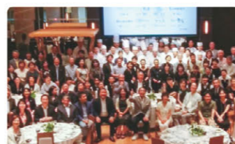
エバーグリーン会（常葉の会） お披露目会