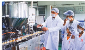
天津テレビ局からの取材

2019年7月に、伊勢にマルタ共和国の少年少女合唱団をお迎えするレセプションパーティーをオレンジで行いました。昨年、伊勢の少年少女合唱団の子供達とご家族がマルタ共和国を訪れ演奏会を催されたことをきっかけに相互訪問の話が持ち上がり、関係者の皆様の熱意とご努力により実現しました。幹事様と打合せをしている中で、伊勢らしくお迎えしたいという熱い思いを感じ、前日まで丁寧な検討を行いました。当日は双方の合唱団による素敵な演奏披露に加え、美味しい食事、美味しいお酒を楽しみながら交流を深めていただきました。