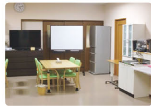
小規模スペースデイ

デイサービス事業所内の一部を改築し、7月から新たに小規模スペースデイがオープンしました。ご自身のペースでゆっくりと時間を過ごしていただける場にはと考えています。活動メニューは選択制になっており、「自分のやりたい事ができる！」と好評です。炊飯やみそ汁作り、おかずの盛り付け、食器洗いなどをしていただく生活リハビリや、ウォーキングマシンや平行棒等を使ったリハビリ、筋トレ・脳トレにも取り組んでいただいております。