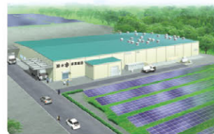
日乃本 新工場完成予想図

2019年7月、「おにぎりせんべい」が発売50周年を迎えました。これを記念して、お客様への感謝とワクワク・ドキドキをお届けすることを目的として、おにぎり倶楽部会員の皆様との共同開発商品（バターしょうゆ味）の発売、株式会社ローソン様との中部エリア限定コラボ商品の発売（からあげくん・焼きおにぎり・焼きうどんのおにぎりせんべい味）、ニチフリ食品株式会社様とのコラボ商品（おにぎりせんべいふりかけ）など様々な企画に取り組みしました。これからも皆様にも長く愛される商品として、変わらないおいしさと新たな挑戦を続けていきます。