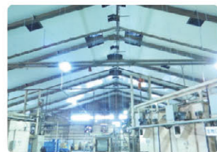
明るくなった天井と照明

（暑さ対策） 近年の夏場の気温上昇によって、生地・焼成工場において作業環境の悪化が問題になっていました。本年、工場建屋と換気装置の大規模修理・改善を行い、作業環境の改善に取り組み、大きな成果を挙げる事ができました。 （LED照明への変更） 政府の推進する省エネルギー政策に対応し、本社工場及び事務所の照明を蛍光灯からLEDに入れ替えました。省エネ効果に加え、蛍光灯を使用していた時よりも明るくなり作業環境の改善にも繋がっております。