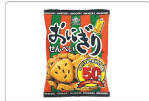
おにぎりせんべい発売 50 周年