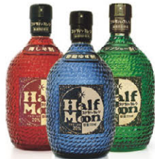
ハーフムーンシリーズ